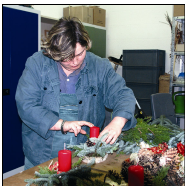
Flechten eines Adventsgestecks